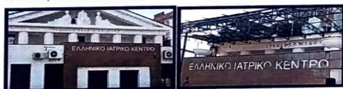
Ελληνικό Ιατρικό Κέντρο

Ανάμεσα σε όλα βομβαρδίστηκαν το Ελληνικό Ιατρικό Κέντρο, το Πολιτιστικό Κέντρο της Ομοσπονδίας Ελληνικών Συλλόγων Ουκρανίας, καθώς και το Μουσείο Τοπικής Ιστορίας.