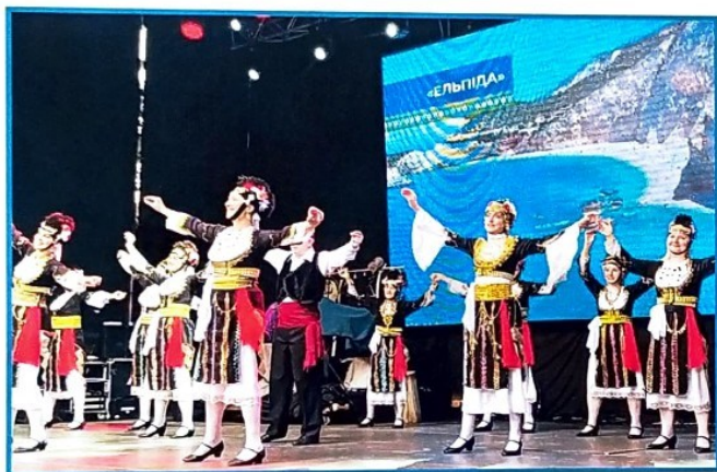
Ελληνικός χορός, Οδησός