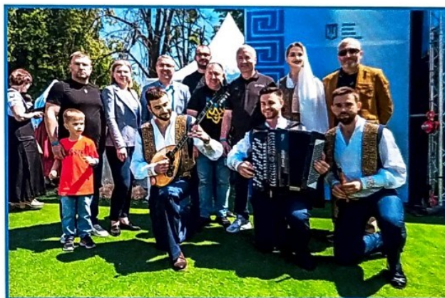
Παραδοσιακές ελληνικές μελωδίες