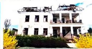
Μουσείο Τέχνης του Αρχιπί Κουίντζι