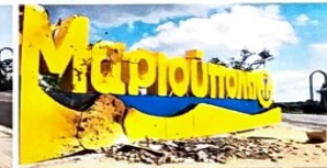
Στήλη «Μαριούπολη» | Ελληνικό Πολιτιστικό κέντρο «Μαιώτιδα»