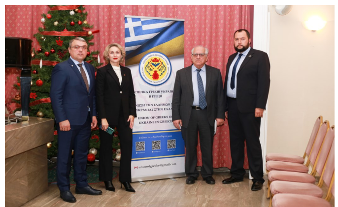
Ο Πρόεδρος της Οιομκω Νίκος Ουζούνογλου με τα μέλη των Συλλόγων Ελλήνων της Ουκρανίας