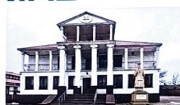
Ομοσπονδία Ελληνικών Συλλόγων Ουκρανίας