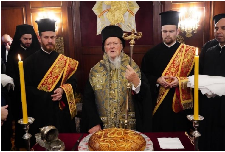
Η Βασιλόπιτα της Αυλής του Πανσέπτου Φαναρίου.

«Ματαιότης ἐστί ματαιοτήτων ἅπαντα», (Εκκλ. 1-2) Παναγιώτατε, Πάτερ και Δέσποτα «ἀλλ' οὐδεις ἐν ἡμῖν ταῦτα φρονῶν εὐρίσκεται, οἱ μὲν γὰρ πλανῶσιν, οἱ δὲ καὶ πλανῶνται». Δοξάζομεν και ευχαριστούμε χαϊδεύοντας με την ψυχή μας το Αχάιδευτο εν Φάτνη Σπηλαιίου Θεῖον Βρέφος, Κυρίω και Θεώ ημών, που Σας αξίωσε και φέτος και σε ὅσα ἔτη Εκείνος επιθυμεί να προσέρχεσθε γονατιστός προσφέροντάς Του το δῶρο των δῶρων Σας... την ψυχήν και την ὑπαρξίν Σας. Την ὑπαρξίν του Ηγουμένου της Μεγάλης Εκκλησίας Του, την ὑπαρξίν του Οικουμενικού Πατριάρχου του πονεμένου ευκλεούς Γένους μας.