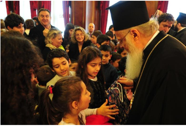
Δώρα προς τα παιδιά των εργαζομένων στο Οικουμενικόν Πατριαρχείον.

Σας ευχόμαστε εγκάρδια, όπως σε κάθε οικογένεια, να συνεορτάσετε εν χαρά, ομόδειπνος μετ' όλης της εκκλησιαστικής Πατριαρχικής Αυλής Σας καθώς και των λαϊκών μελών Της. Να ευλογήσετε την Βασιλόπιττα, «τό Δῶρον τούτο, τῆς προγονικῆς ἡμῶν κληρονομιάς, ὡς εὖ σύμβολον συνδέσμου εἰρήνης και ἀγάπης προς τον συνάνθρωπον... το οποίον φεῦ, δεν γλύτωσε από την λαίλαπα τῆς στοχευόμενης παραποίησης και διαφημίζεται από φέτος ως «παραδοσιακή» πρωτόπιτα, αγνοώντας ότι οι συνταγές τῆς εἶναι ἀρρηκτα συνδεδεμένες με το ὄνομα του Μεγάλου Αγίου.