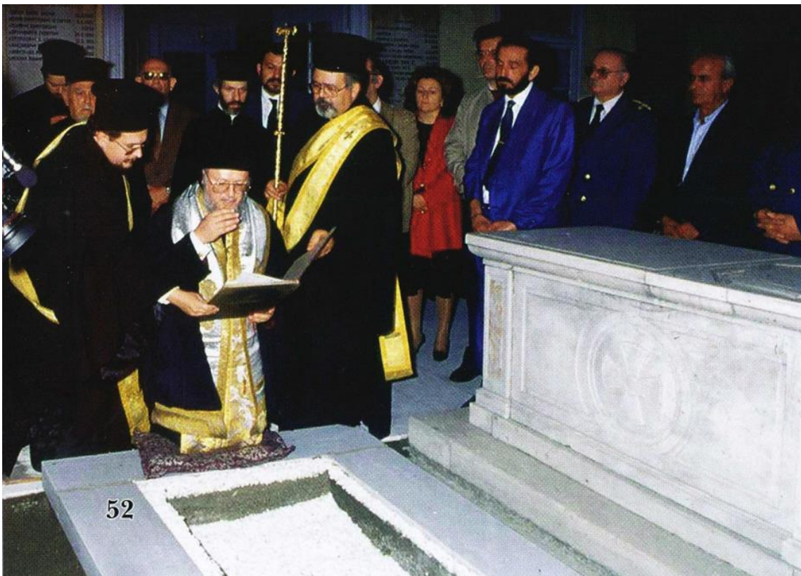
2) Ο Παναγιώτατος γονυπετὴς διαβάξει Τρισάγιο στον τάφο του Προκατόχου Του αείμνηστου Πατριάρχου Δημητρίου παρουσία πιστῶν.