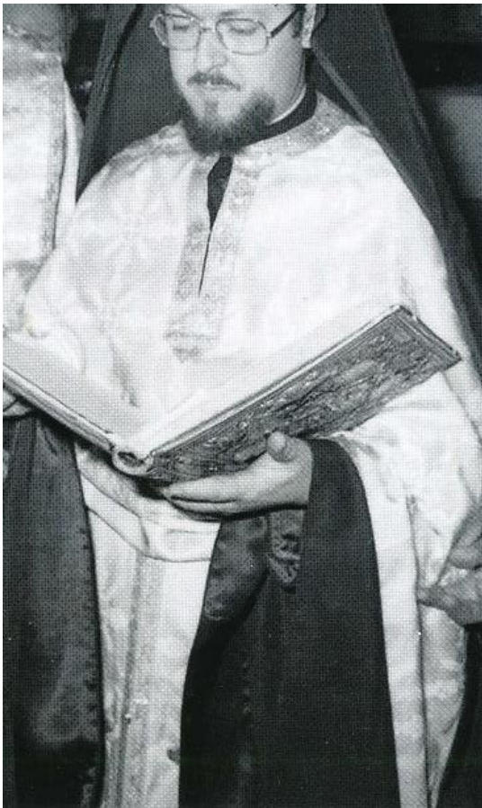
5) 25.12.1973. Ο έψηφισμένος Μητροπολίτης Φιλαδελφείας Βαρθολομαῖος κατά την ιερά στιγμή που δίνει όμολογία πίστεως έμπρός από την Ώραία Πύλη.