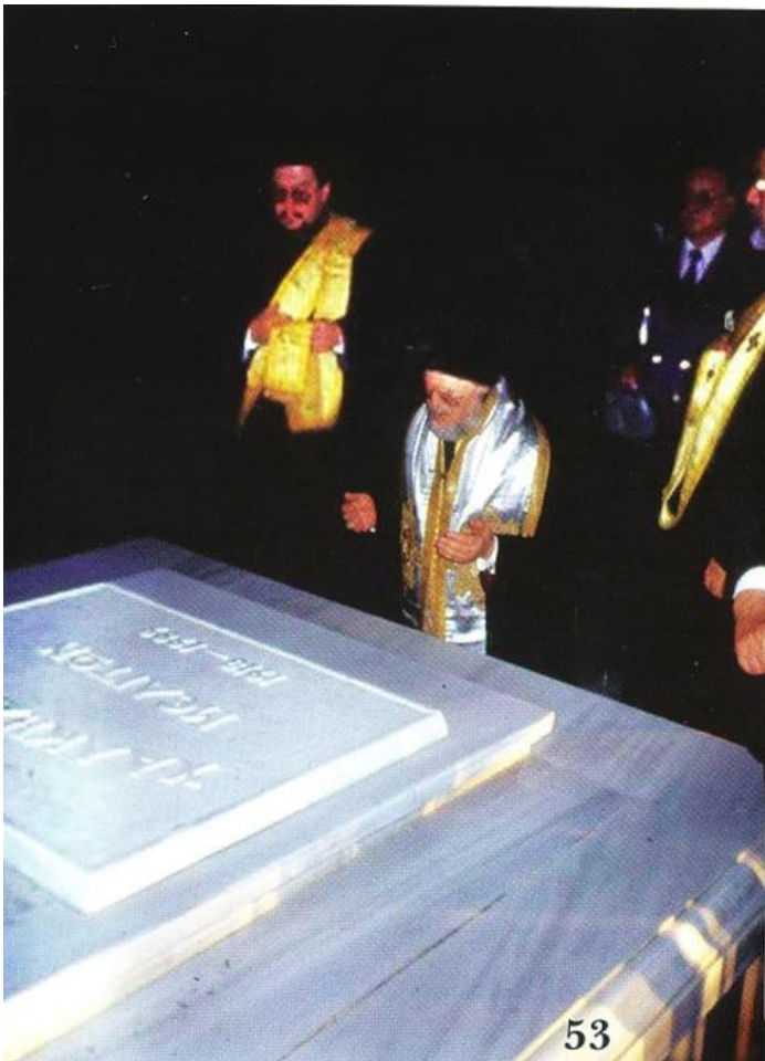
4) Ο Πατριάρχης τελεί Τρισάγιο υπέρ αναπαύσεως τῆς ψυχῆς τοῦ Γέροντά Του αείμνηστου Μητροπολίτου Χαλκηδόνος Μελίτωνος πού τόσα πολλά τοῦ ὀφείλει.