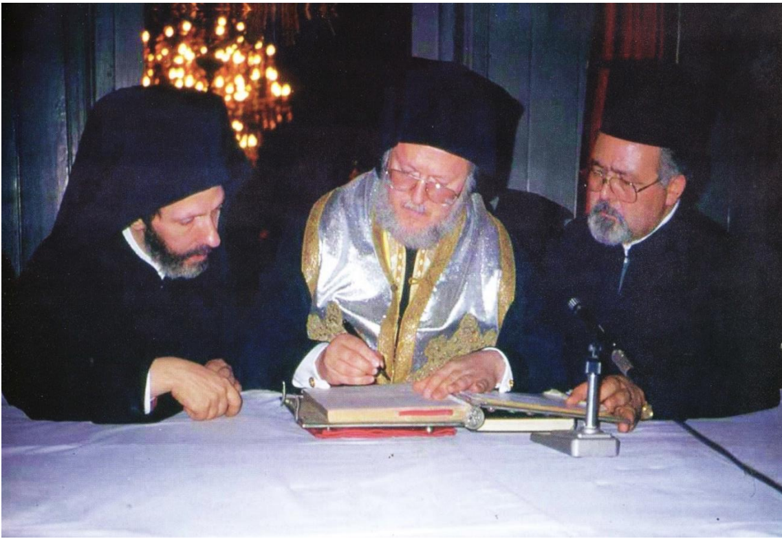
6) Ο νεοεκλεγείς Οικουμενικός Πατριάρχης υπογράφει ἐντὸς τοῦ Ἁγίου Βήματος τὸ κείμενο τοῦ Μεγάλου Μηνύματος καὶ τῆς Εὐχαριστίας.