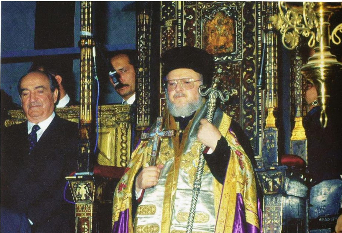
12) Μετὰ τὸ τέλος τῆς ἐνθρονίσεως ὁ Πατριάρχης εὐλογεῖ τὸ ἐκκλησίασμα. Στὸ παραθρόνιο ὁ Πρωθυπουργὸς τῆς Ἑλλάδος κ. Κωνσταντῖνος Μητσοτάκης.