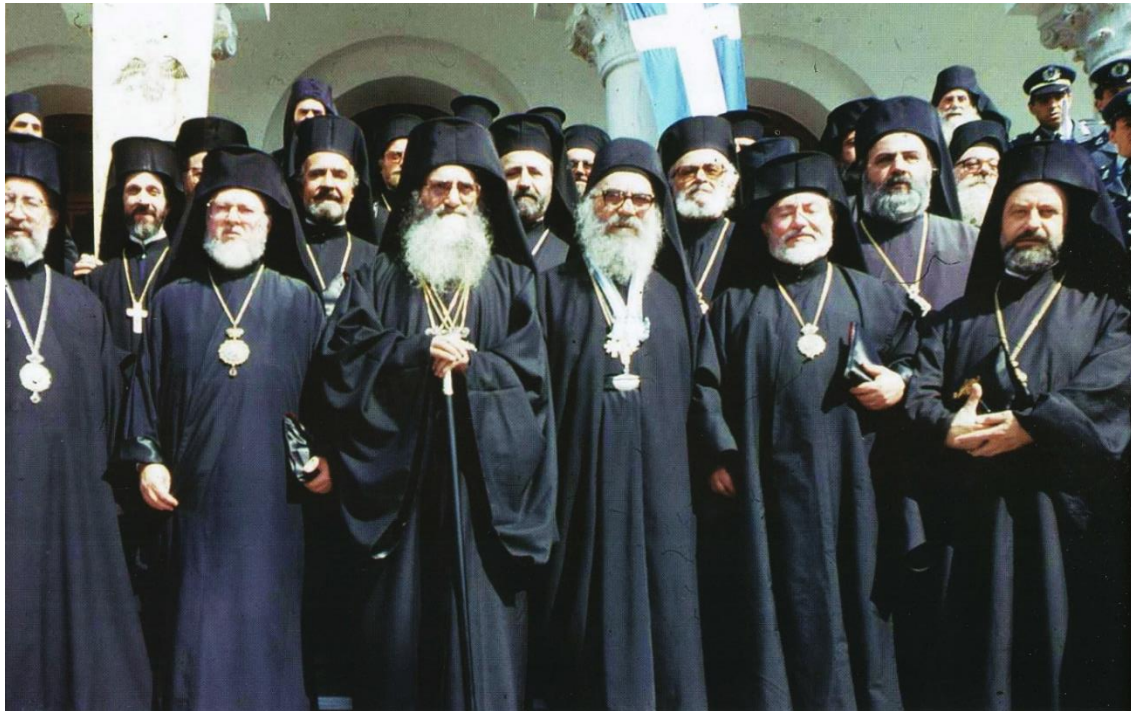
7) Στὴν Ἱερὰ Κοινότητα Ἁγίου Ὁρους Ὁ Οἰκουμενικὸς Πατριάρχης Δημήτριος, ὁ Χαλκηδόνος Βαρθολομαῖος καὶ οἱ ὑπόλοιποι Ἀρχιερεῖς τοῦ Θρόνου.