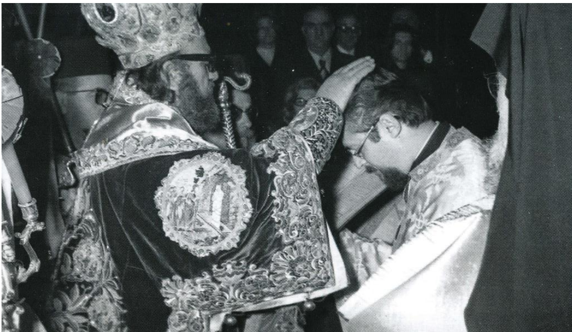
11) 25.12.1973. Μετά την όμολογία ό έψηφισμένος Μητροπολίτης Φιλαδελφείας Βαρθολομαῖος στέκεται με εύλάβια έμπρός από τον Πατριάρχη Δημήτριο και δέχεται τις εύλογίες του.