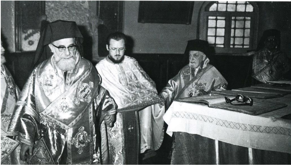
3) Οι Μητροπολίτες Γέρων Χαλκηδόνος Μελίτων και Νεοκαισάρειας Χρυσόστομος περιφέρουν τὸν ἐψηφισμένο τρεῖς φορές γύρω ἀπὸ τὴν Ἁγία Τράπεζα κατὰ τὴν ἱερὰ στιγμή τῆς χειροτονίας του σὲ Ἐπίσκοπο.