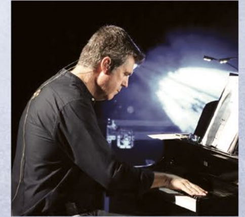
ΓΙΩΡΓΟΣ ΠΑΠΑΧΡΙΣΤΟΥΔΗΣ Καλλιτεχνική διεύθυνση/ Ενορχηστρώσεις