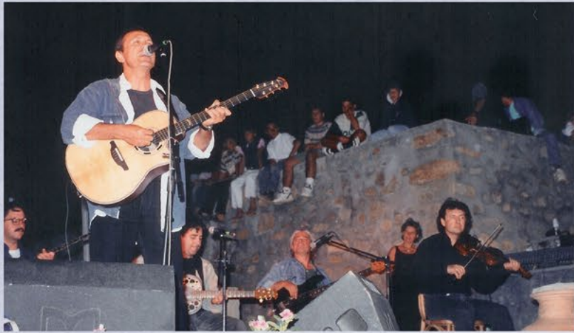
Συναυλία Γιώργου Νταλάρα 1996