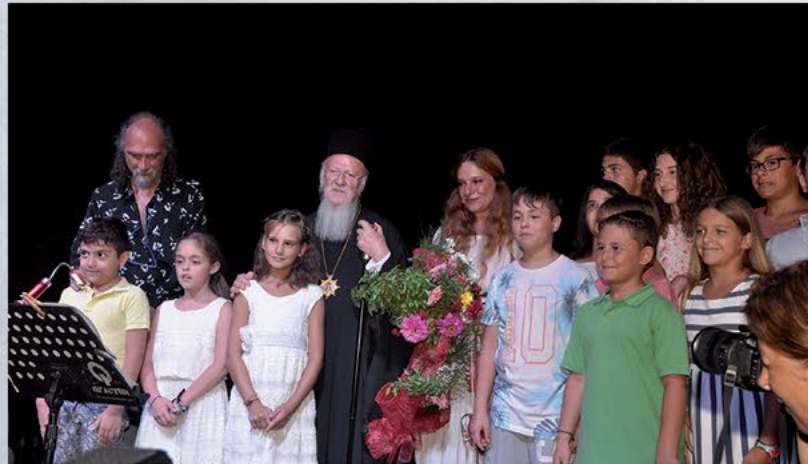
Συναυλία Ευανθίας Ρεπούτσικα 2016