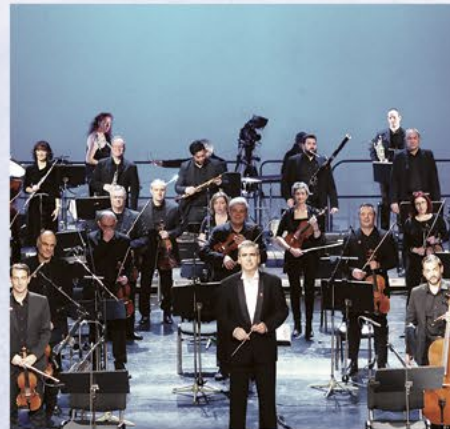
ΟΡΧΗΣΤΡΑ ΣΥΓΧΡΟΝΗΣ ΜΟΥΣΙΚΗΣ ΕΡΤ

Συνέθεσε και ερμήνευσε, με άλλους καλλιτέχνες, το τραγούδι «Ίμβρος» από τον δίσκο του «Τένεδος» (1991).