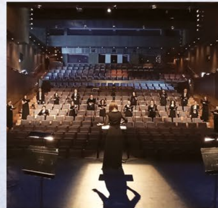
ΧΟΡΩΔΙΑ ΤΗΣ ΕΡΤ