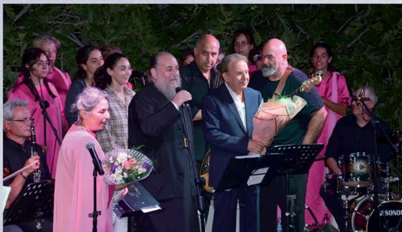
Συναυλία Μανώλη Μητσιά 2023