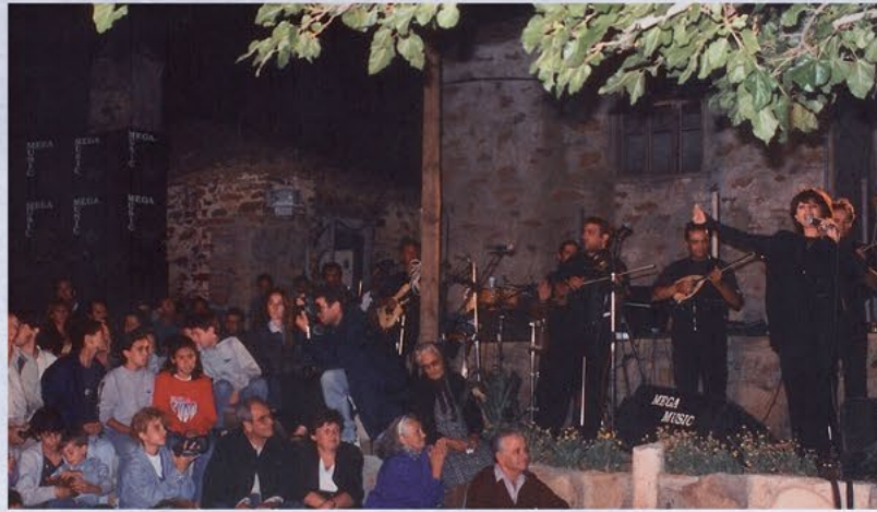
Συναυλία Γλυκερίας 1997