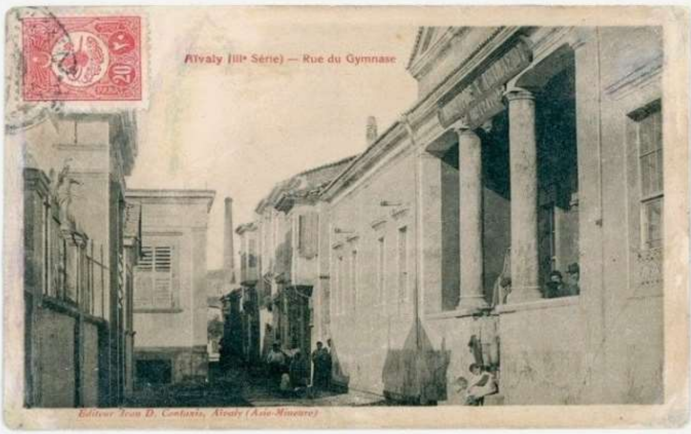
Agios Dimitrios Church