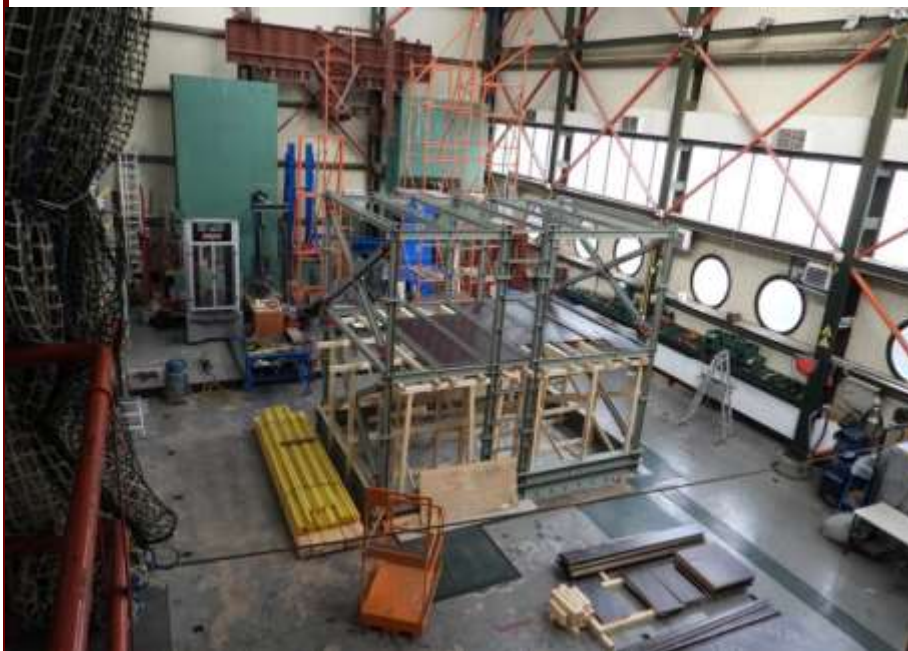
Εργαστήριο Αντισεισμικής Τεχνολογίας του Εθνικού Μετσόβιου Πολυτεχνείου