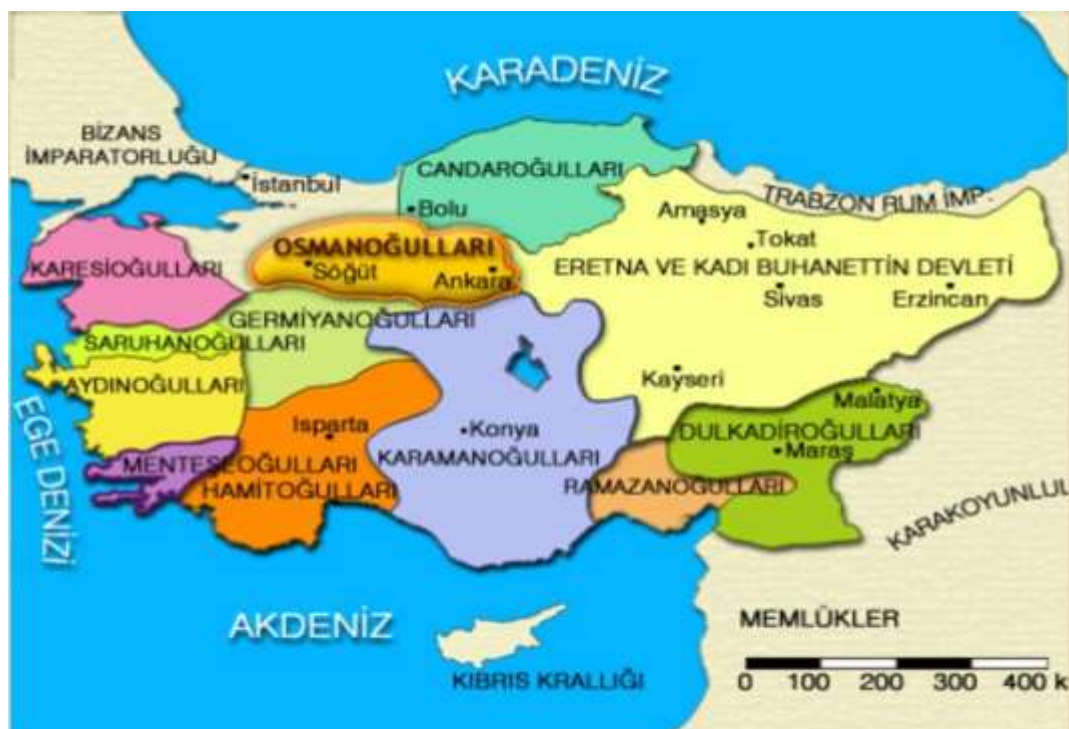
Φωτ. 3. Τα εμιράτα στην Μικρά Ασία στα τέλη του 13ου αιώνα

Αρχικά στην Ενότητα 1, αναλύεται η σχέση του Βυζαντινού Κόσμου με τουρκικά φύλα (Ούνοι, Αβάροι, Βούλγαροι, Χαζάροι, Πατσινάκοι, Ούζοι, Κουμάνοι) - Προσπάθειες του Βυζαντίου για εκχριστιανισμό τους. Η χρήση των Τουρκικών φύλων ως μισθοφόρων. Η χρήση στα θέματα Τούρκων στρατιωτών - Οι μάχες Μάντζικερτ και Μυριοκεφάλου - τα Τουρκόπουλα – ο Ιωάννης Αξούκχος – Η οικογένεια του Izzedin Keykanus – Οι Καταλανοί και τα Τουρκόπουλα – ΟΥΔΕΜΙΑ αναφορά πηγής που να αναφέρει την εγκατάσταση τουρκικών φύλων ως στρατιωτών στην Μικρά Ασία.