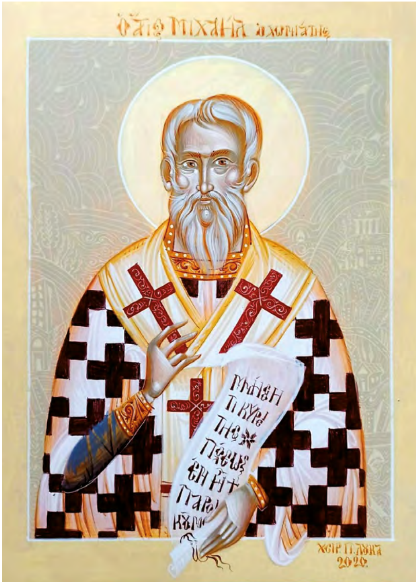
Ὁ ἅγιος Μιχαήλ ὁ Χωνιάτης. Ἔργο τοῦ π. Λουκᾶ Καρούσου, Καλύβια Θορικοῦ 2020.