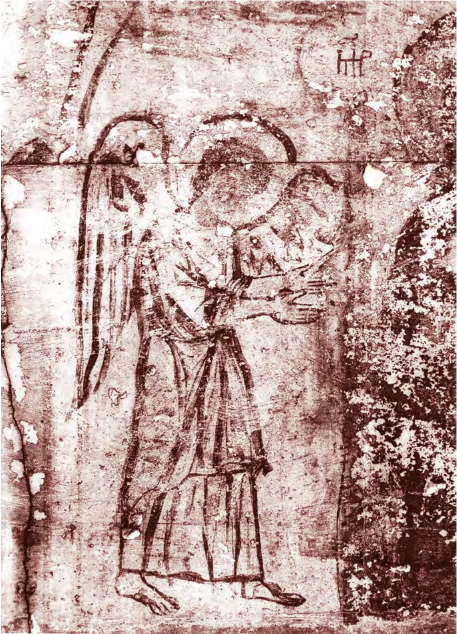
Ἄγγελος σὲ δέση. Τοιχογραφία ἀπὸ τὴν Παναγία τὴν Ἀθηνιώτισσα-Παρ- θενῶνα. Ἔργο τοῦ 12ου αἰῶνος ἀπὸ τὸν ἐξωραϊσμό τοῦ Ναοῦ ποὺ ἔλαβε χώρα ἐπι- τῶν ἡμερῶν τοῦ ἀγίου Μιχαήλ.