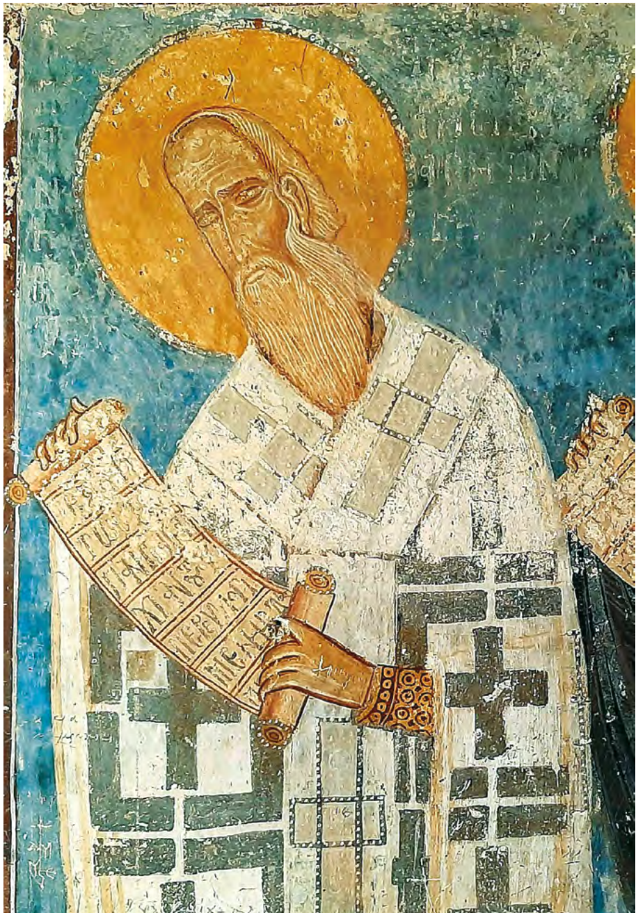
Ὁ ἅγιος Μιχαὴλ Χωνιάτης, Μητροπολίτης Ἀθηνῶν. Τοιχογραφία 13ου αἰῶνος ἀπὸ τὸν Ἱερὸ Ναὸ Ἁγίου Πέτρου, Καλυβίων Κουβαρᾶ.