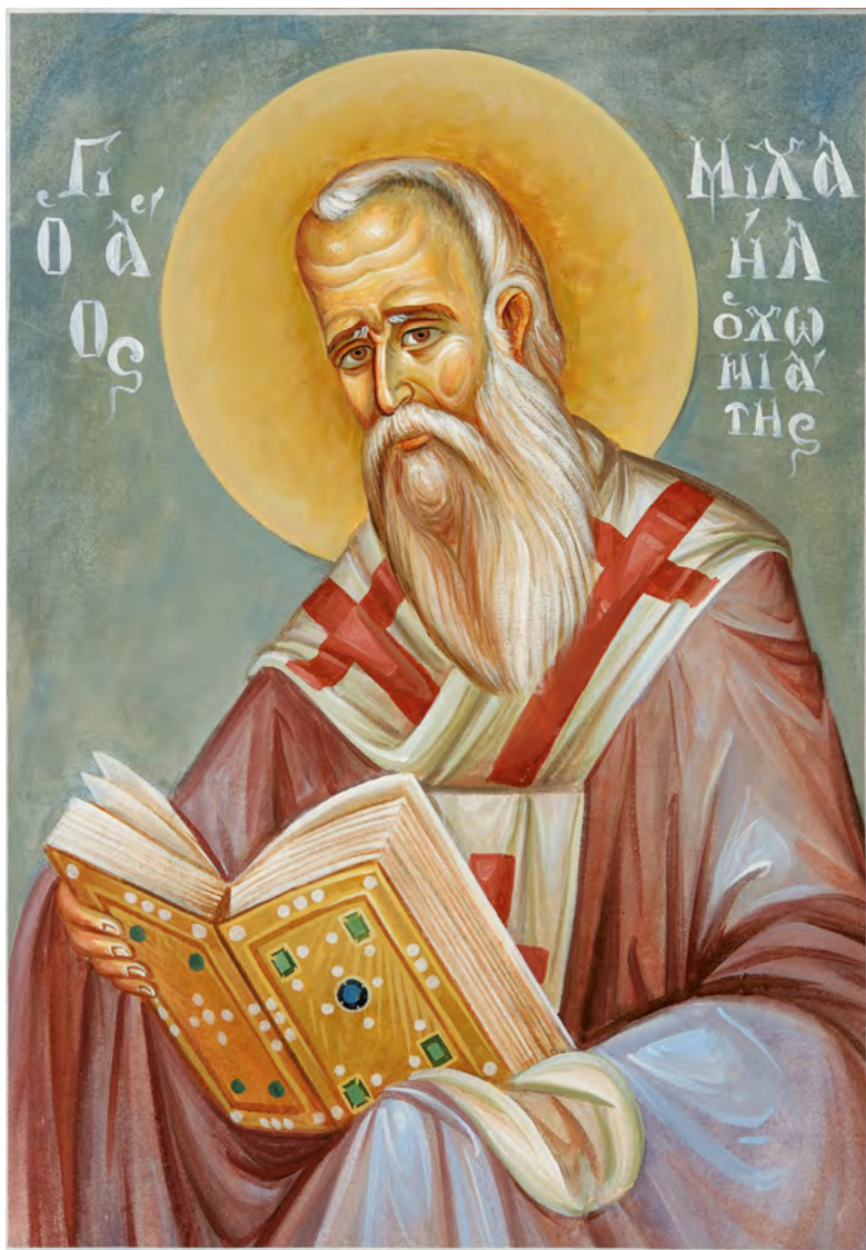
Ὁ ἅγιος Μιχαὴλ ὁ Χωνιάτης. Ἔργο Γεωργίου Εὐαγ. Ἀγγελῆ στὸν Ἱερὸ Ναὸ Ἁγίου Φανουρίου Καρελλᾶ Κορωπίου.