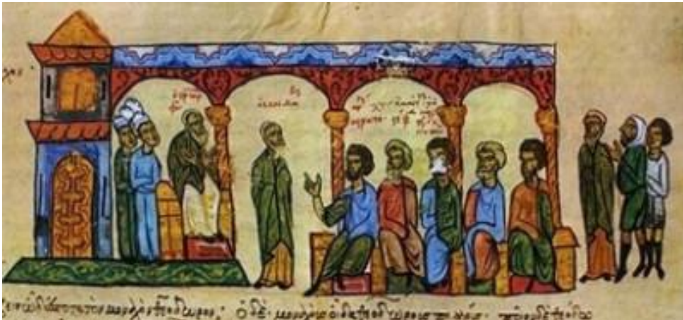
Ο πατριάρχης Φώτιος σε ώρα διδασκαλίας. Μικρογραφία από την Ιστορία του Σκυλίτζη. 12 ος αι.

Με τον όρο «κατήχηση» εννοούμε το εκκλησιαστικό φιλολογικό είδος το οποίο υπό διαφορετικές μορφές αντηχεί στους εκκλησιαστικούς χώρους ήδη από την αποστολική εποχή, διαμορφούμενο αναλόγως των τόπων και των επικρατούντων ιστορικών συνθηκών. Διαφορετικό είναι το περιεχόμενό τους κατά την απολογητική περίοδο, άλλο στις Κατηχητικές Σχολές της Αλεξάνδρειας και της Αντιόχειας, διαφορετικά στοιχείται από τους Καππαδόκες με έντονο μυσταγωγικό χαρακτήρα. Εκπίπτει κατά την Εικονομαχία για να επανακάμψει με έμφαση στην αγιολογία-εορτολογία και να ανθίσει αμέσως μετά στην περίοδο του λεγόμενου πρώτου βυζαντινού ουμανισμού αναδεικνύοντας την ρητορική δεινότητα των ομιλητών.