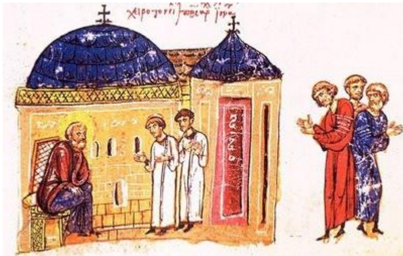
Σκηνή διδασκαλίας-κατήχησης από το χειρόγραφο της Ιστορίας, του Ιωάννη Σκυλίτζη, 12 ος αι.

Εύλογα, λοιπόν, δημιουργείται η υποψία ότι δεν τον παρακολουθούσαν μόνο αμόρφωτοι και ακαλλιέργητοι αγρότες, αλλά και μία ανώτερης ίσως παιδείας τοπική «αριστοκρατία» ή έστω άτομα που πρέπει να γνώριζαν ως ένα βαθμό την ιστορική παράδοση της αρχαιότητας. Πάντως, ο τρόπος που αναμειγνύει τις αρχαίες ελληνικές έννοιες και εκφράσεις με τη γενικότερη επιχειρηματολογία και τους σκοπούς της κάθε κατήχησης, καθιστά ως ένα σημείο οικείες τις έννοιες αυτές, ενώ η αναφορά σε διαπρεπή πρόσωπα του ιστορικού παρελθόντος του τόπου θα μπορούσε να προκαλέσει το δέος και να εμπνεύσει αυτοπεποίθηση, που ίσως κινητοποιούσε τον αμαθή, ακόμα κι αν δεν γνώριζε ή δεν μπορούσε να καταλάβει τη συμβολή των προσώπων αυτών.