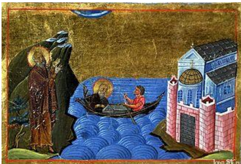
Μονή Σπουδίου. Μηνολόγιο Βασιλείου. 11ος αι.

Απόηχος των κατηχήσεων σήμερα αποτελεί ο κατηχητήριος λόγος που εξαπολύει προ της Μεγάλης Τεσσαρακοστής ο Πατριάρχης Κωνσταντινουπόλεως, μια παράδοση που φαίνεται να έχει τις ρίζες της στις «Μεγάλες Κατηχήσεις των Μονών Σακκουδίωνος της Βιθυνίας και Στουδίου ήδη προ του 815 μ.Χ..