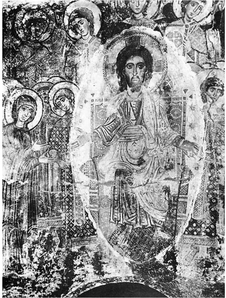
Η Δευτέρα παρουσία, λεπτομέρεια. Ι. Ν. Αγ. Γεωργίου Κουβαρά.