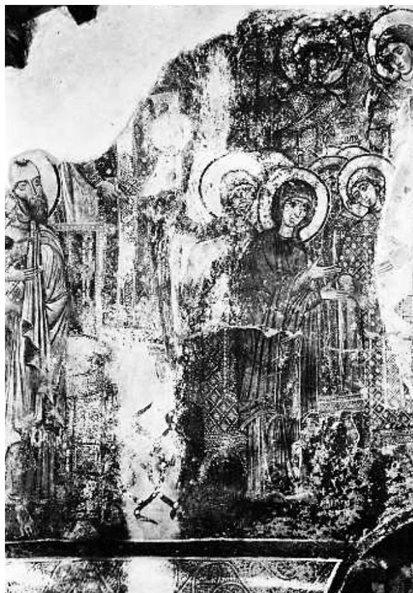
Η Δευτέρα παρουσία, λεπτομέρεια. I. Ν. Αγ. Γεωργίου Κουβαρά.

Ο Πέτρος στρέφεται προς το κέντρο της σύνθεσης. Ταυτίζεται με ευκολία τόσο από τα φυσιογνωμικά του χαρακτηριστικά, όσο και από τα κλειδιά που κρατά στα χέρια του ως φύλακας του Παραδείσου. Η εικονογραφική αυτή λεπτομέρεια συνηθίζεται στην ζωγραφική παράδοση στους πρώτους χριστιανικούς χρόνους και σταδιακά καθίσταται σπάνια στο Βυζάντιο μέχρι τον 13 ο αιώνα, ενώ αντίθετα διατηρείται στη δυτική εικο-