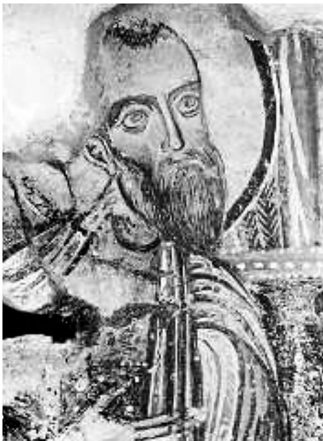
Η Δευτέρα παρουσία, λεπτομέρεια. Ι. Ν. Αγ. Γεωργίου Κουβαρά.

στη (ίσως και μοναδική) τοποθέτησή της στο τέμπλο αντί του νάρθηκα του ναού αιφνιδιάζει και εγείρει ερωτηματικά. Έχει υποστηριχθεί (χωρίς όμως την απαραίτητη ανασκαφική τεκμηρίωση), πως αυτό θα μπορούσε να ερμηνευθεί από την χρήση του) ναού κυρίως ως κοιμητηριακού... Εάν κάτι τέτοιο ισχύει, η κατεξοχήν αυτή εσχατολογική παράσταση θα ήταν ορατή από το ποίμνιο καθ' όλη την διάρκεια της εξοδίου ακολουθίας και θα επιτελούσε πλήρως τον παιδαγωγικό και ποιμαντικό της σκοπό. Σε κάθε περίπτωση, θα μπορούσε να υποτεθεί (ενδεχομένως βάσιμα), πως ο ζωγράφος δύσκολα θα μπορούσε να προβεί σε αυτήν την «αυθαίρετη» χωροταξική παρατοποθέτηση, χωρίς την καθοδήγηση ή έστω την ανοχή κάποιου θεολογικά καταρτισμένου δωρητή. Η υπόθεση αυτή δεν μπορεί να επιβεβαιωθεί καθώς δεν σώζεται καμία κτητορική ή αφιερωματική επιγραφή.