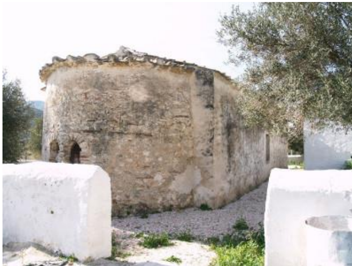
Ι. Ν. Αγ. Γεωργίου Κουβαρά