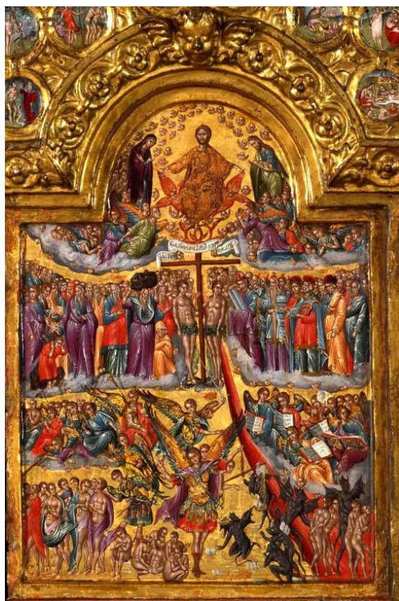
Η δευτέρα παρουσία. Λεπτομέρεια Τριπτύχου. Γεωρ. Κλόντζα, τέλη 16 ου .

Το τέταρτο κατά σειρά αφιέρωμα στον άγιο Μιχαήλ τον Χωνιάτη συμπίπτει με την εορτή των Απόκρεω. Μάλιστα την Κυριακή αυτή αναγιγνώσκεται το χωρίο εκ του Ευαγγελίου στο οποίο ο Χριστός περιγράφει την δευτέρα έλευσή Του, την δευτέρα παρουσία.