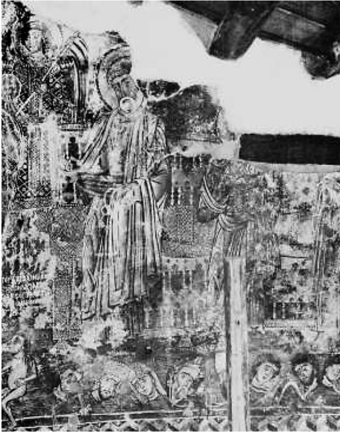
Η Δευτέρα παρουσία, λεπτομέρεια. Ι. Ν. Αγ. Γεωργίου Κουβαρά.

νογραφία. Η σποραδική επανεμφάνισή της τον 13 ο αιώνα στην μνημειακή ζωγραφική της ανατολικής Εκκλησίας, θεωρείται δυτική επιρροή. Ο Παύλος στρέφεται ελαφρώς προς το κέντρο της σύνθεσης, με το δεξί του χέρι να προβαίνει σε χειρονομία ικεσίας, χωρίς να κρατά κώδικα ή ειλητάριο, όπως συνηθίζεται. Ιδιαίτερη είναι και η απόδοση της μορφής του, καθώς εικονίζεται με λιγότερο εμφανή τα σημεικά του χαρακτηριστικά και με γκριζα μαλλιά και γένια, απεικόνιση εξαιρετικά σπάνια.