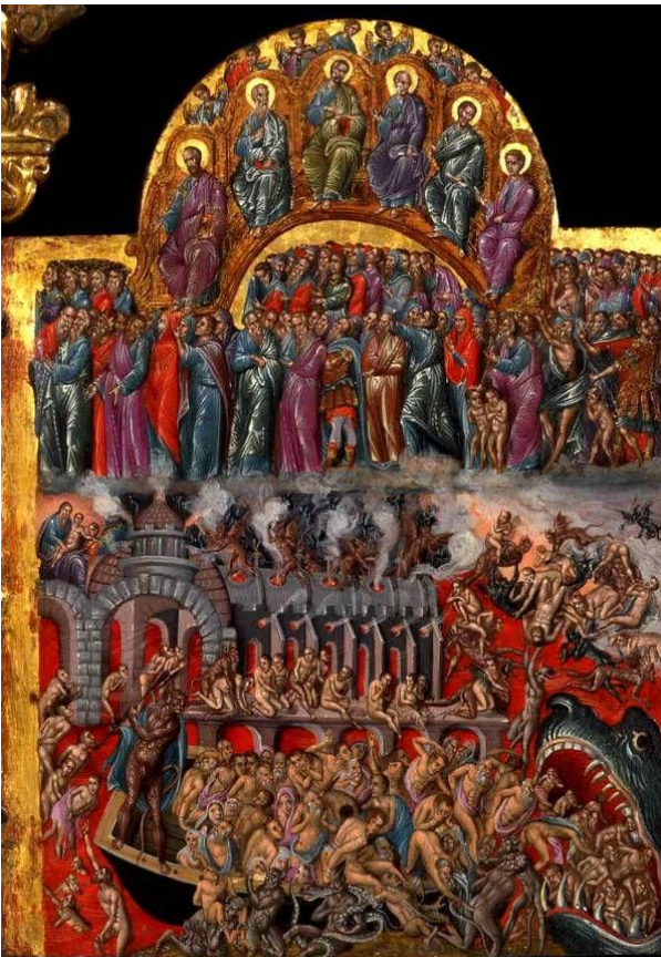
Η δευτέρα παρουσία. (δ.π.)

δεξιό μέρος: «Εμπρός, προχωρήστε οι στεφανωμένοι με τις ευλογίες του Πατέρα μου, να είστε κληρονόμοι της βασιλείας που διαρκεί αιώνια γιατί δώσατε τροφή, νερό και χιτώνα στους φτωχούς» και σε αυτούς που βρίσκονται στα αριστερά είπε: «Καταραμένοι και άσπλαχνοι, φύγετε μακριά από μένα στο αθάνατο φλογερό πυρ». Τότε βέβαια για τους αγαθούς έχει ανοίξει εντελώς ένας εράσιμος κήπος που αφθονεί σε δέντρα με περιβόλια γεμάτα καρπούς όσα ο Θεός καλλιεργώντας με φροντίδα άφησε να φυτρώσουν από την αρχή του κόσμου, ενώ η άκρη της φλόγας ως φρουρός σ' αυτά εδώ υποχώρησε για ν' απολαμβάνουν τα φυτά της αιώνιας ζωής. Από την άλλη γύρω από το Θεό σχηματίζουν ακατάπαυστα χορωδία και γεμίζουν με την αγαλλίαση του πραγματικού φωτός ψάλλοντας μαζί με τους αγγέλους που υμνολογούν άσματα.